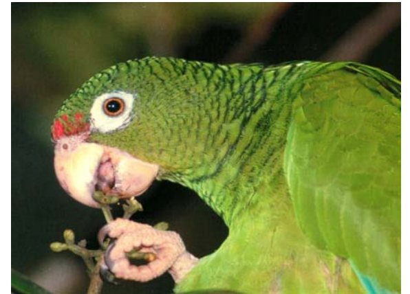
Cotorra puertorriqueña, en peligro de extinción.