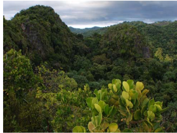
Vista del Karso norteño caracterizado por mogotes, cuevas y sumideros.

El Karso cubre cerca de una cuarta parte de Puerto Rico y se distingue generalmente por afloramientos de roca caliza, mogotes, sumideros, cuevas y ríos subterráneos. Se encuentra en una franja continua desde Aguadilla hasta Loíza en el Norte, de forma discontinua en el Sur, en varios bolsillos en el interior de la Isla (Ej. Cayey, Aguas Buenas, Barranquitas, San Germán, etc.), el extremo este de Vieques, Isla de Mona y Monito.