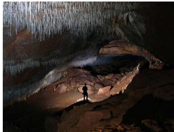
Cueva Sorbeto en Arecibo, aledaña al Río Tanamá en el Karso del Norte.

El Estudio del Karso identificó un 35% del total del Karso en Puerto Rico, incluyendo los bosques estatales (Ej. Bosque de Río Abajo, etc.) y reservas naturales (Ej. Laguna Tortuguero, etc.) en esta zona, como un área con prioridad de conservación (AKPC). Dicha extensión cubre solamente un 9.9% de la Isla. En las AKPC, como consecuencia, está prohibida la ubicación de canteras y proyectos urbanos nuevos que conlleven movimiento de terrenos.