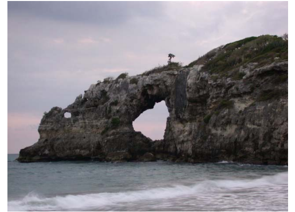
Punta Ventanas en Guayanilla, en la región del Karso del sur.

La roca caliza del Karso tiende a ser muy porosa, lo que facilita que se infiltre el agua de lluvia, resultando en la formación de los abastos de agua subterránea o acuíferos más importantes en Puerto Rico. En el Karso podemos encontrar, también, los bosques más extensos en la Isla, en los que habita la población más numerosa de la cotorra puertorriqueña junto a especies que no existen en otro lugar del planeta, tales como el coquí llanero, la mariposa arlequín y el sapo concho, entre otras.