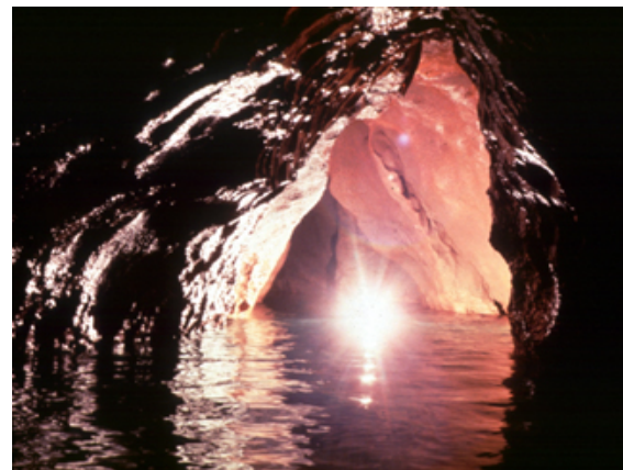
Pasaje subterráneo del Río Encantado en Ciales.

La roca caliza del Karso tiende a ser muy porosa, lo que facilita que se infiltre el agua de lluvia, resultando en la formación de los abastos de agua subterránea o acuíferos más importantes en Puerto Rico. En el Karso podemos encontrar, también, los bosques más extensos en la Isla, en los que habita la población más numerosa de la cotorra puertorriqueña junto a especies que no existen en otro lugar del planeta, tales como el coquí llanero, la mariposa arlequín y el sapo concho, entre otras.