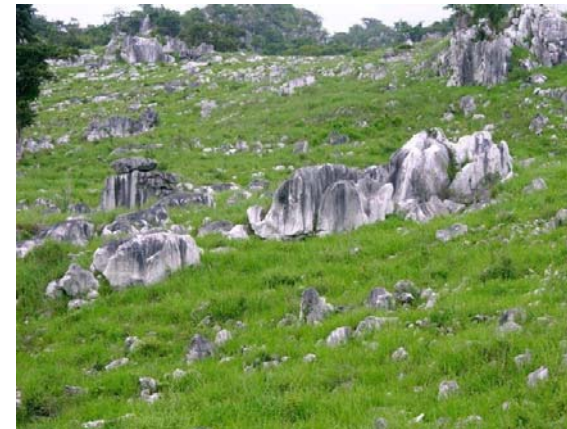
Cerro Cuevas en Juana Díaz, en la región del Karso del sur.